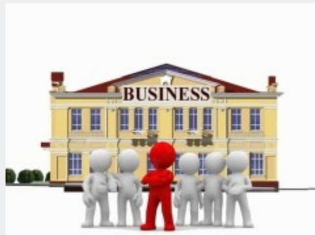
Адрес места нахождения ЮЛ